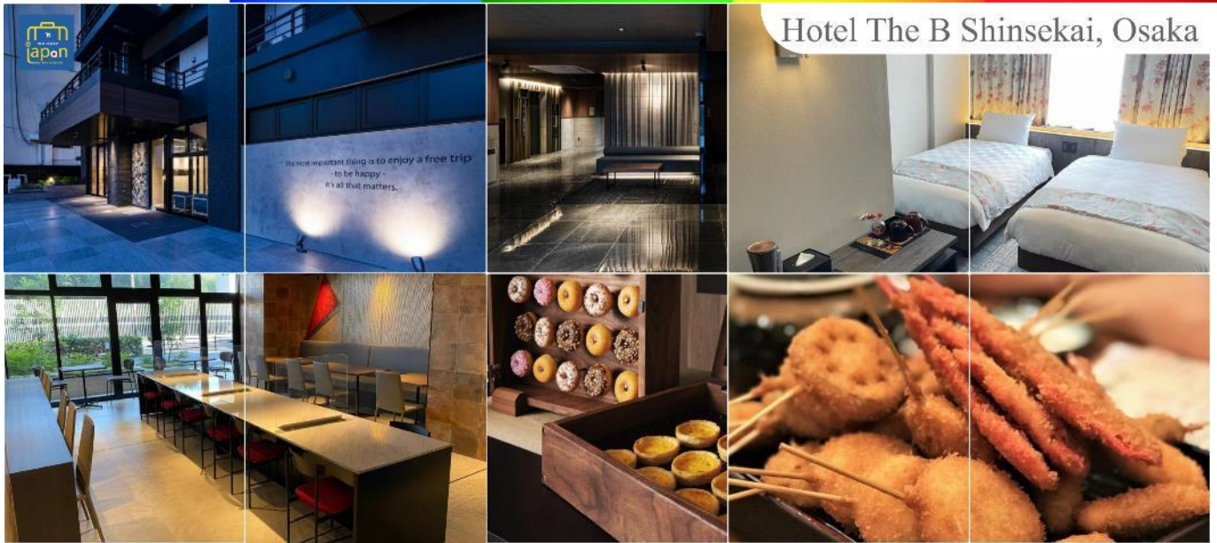
Hotel The B Shinsekai, Osaka