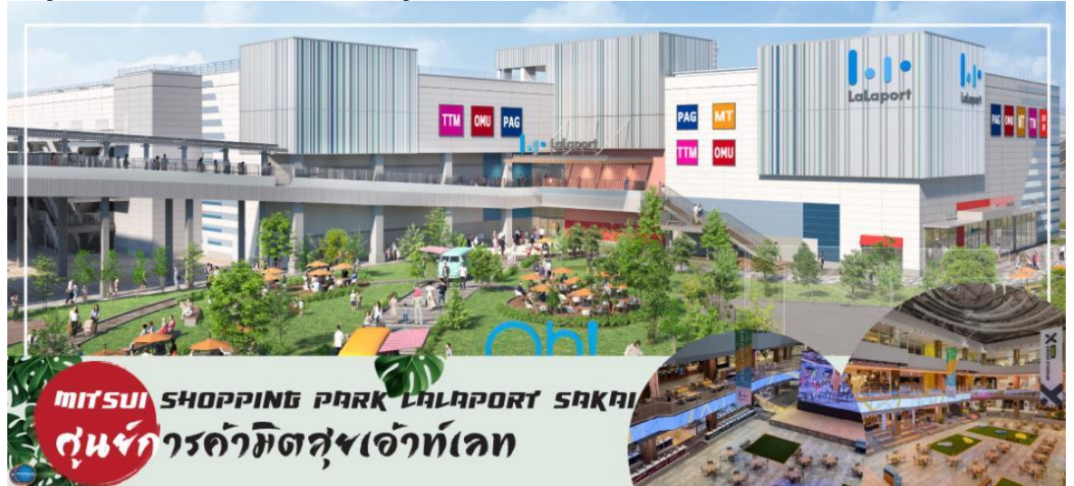
MITSUI SHOPPING PARK LALAPORT SAKAI ศูนย์การค้ามิตซูบิชิเอาท์เล็ต

นำท่านสู่ LALAPORT & MITSUI OUTLET PARK OSAKA KADOMA มีกำหนดเปิดให้บริการในวันที่ 17 เมษายน 2023 ที่ผ่านมา ซึ่งถือเป็นสาขาใหม่ล่าสุดที่มีเอกลักษณ์ในญี่ปุ่น โดยปกติแล้วศูนย์การค้าและเอาท์เล็ตจะแยกกันคนละที่ ดังนั้น นี่จึงเป็นครั้งแรกที่เป็นการรวมศูนย์การค้าขนาดใหญ่เข้าด้วยกันกับOutlet ขนาดใหญ่แห่งแรก ห้างสรรพสินค้าที่มีสิ่งอำนวยความสะดวกครบครัน