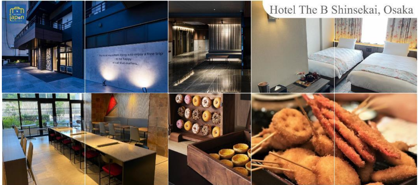
Hotel The B Shinsekai, Osaka

พักที่ HOTEL THE B SHINSEKAI, OSAKA หรือเทียบเท่าระดับเดียวกัน