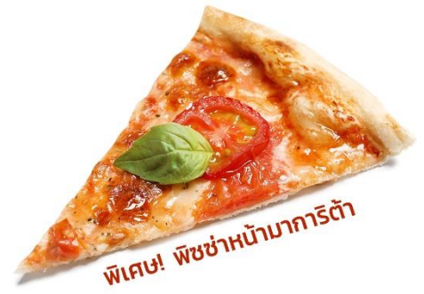
พิเศษ! พิซซ่าหน้ามาการิต้า

นำท่านเดินทางสู่ เมืองโคโม (Como) (ระยะทาง 51 กม. / 1 ชม. นาทีก) ตั้งอยู่บริเวณพรมแดนกับประเทศสวิตเซอร์แลนด์ โคโมเป็นเมืองที่ตั้งอยู่ในเทือกเขาแอลป์ พาทุกท่านไปเก็บภาพความประทับใจกับ ทะเลสาบโคโม (Lake Como) ขึ้นชื่อว่าเป็นทะเลสาบที่สวยงามที่สุดในโลก มีรูปร่างลักษณะเฉพาะของทะเลสาบโคโมทำให้นึกถึง Y ที่กลับด้านที่โด่งดังไปทั่วโลก เป็นผลมาจากการละลายของธารน้ำแข็งรวมกับการกัดเซาะของแม่น้ำ Adda โบราณ ทำให้เกิดทางแยกเป็นตัว Y และยังเป็นทะเลสาบมีทิวทัศน์ที่งดงามที่สุดแห่งหนึ่งในโลก