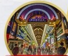
ช้อปปิ้งทานุกิโคชิ