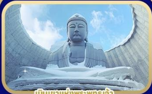
เป็นเขาแห่งพระพุทธรเจ้า