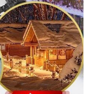
บึงเกลือทอเรส