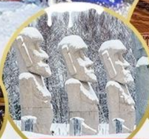
รูปปั้นหินโมอาย