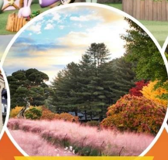
Garden of morning clam