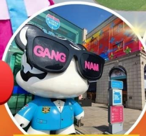
ช้อปปิ้งคังนัม