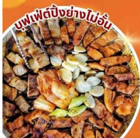
บุฟเฟ่ต์บั้งย่างไม่อั้น

สัมผัสบรรยากาศโรแมนติกเกาะนามิ สวนดอกไม้ Garden of Morning Clam สักการะพระพุทธรูปขนาดใหญ่ใจกลางโซล ห้องสมุดสุดชิค Starfield Library สนุกสุดมันส์ สวนสนุกล็อตเต้เวิลด์ ยอดเขานัมซานโซลทาวเวอร์ อิสระช้อปปิ้งคังนัม Lotte Duty Free