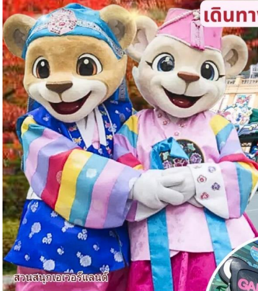
สวนสนุกเอเวอร์แลนด์