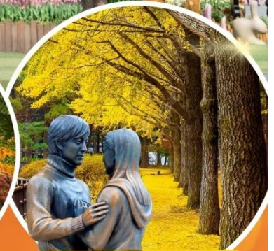
เกาะนามิ