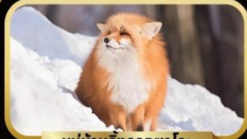
หมู่บ้านจิ้งจอกซาโอะ