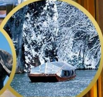
ล่องเรือเทบิค