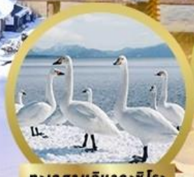
ทะเลสาบอินาวะชิโระ