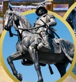
ดาเตะ มาซามูเนะ