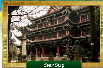
วัดเหวินซู