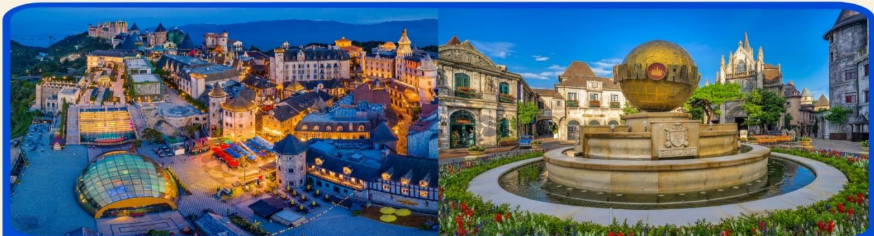
พักผ่อน บานาฮิลล์ 1 คืน