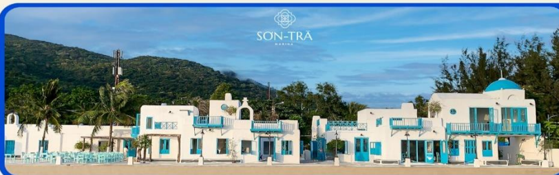
เช็คอินคาเฟ่ SON TRA MARINA