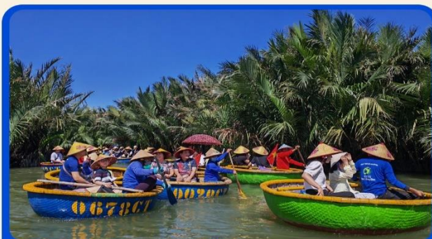
พิเศษ !!! นั่งเรือกระด้ง UNSEEN เวียดนาม