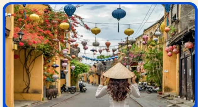
เที่ยวเมืองเก่าฮอยอัน