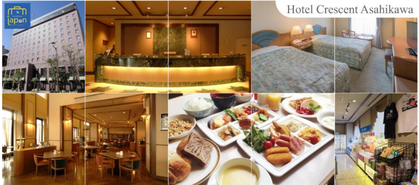
Hotel Crescent Asahikawa

HOTEL CRESCENT ASAHIKAWA หรือเทียบเท่าระดับเดียวกัน