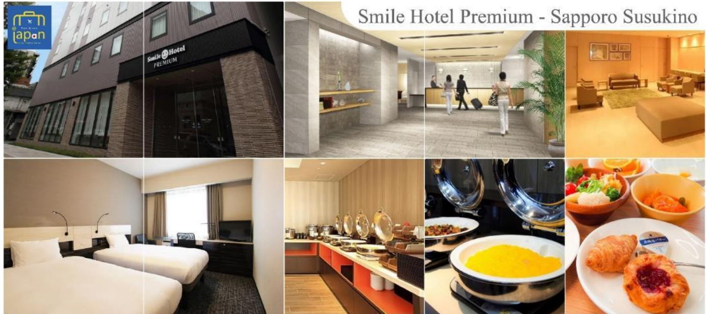
Smile Hotel Premium - Sapporo Susukino

SMILE HOTEL PREMIUM - SAPPORO SUSUKINO หรือเทียบเท่าระดับเดียวกัน