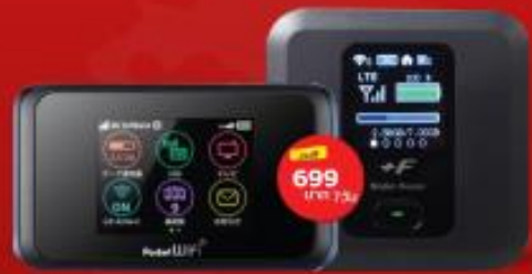
POCKET WIFI สำหรับนำไปใช้กับระบบการบิน เช่นเดียวกับมือถือ