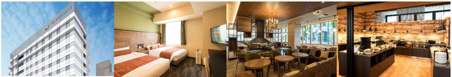
** ภาพบรรยากาศโรงแรม REMBRANDT STYLE SAPPORO

ชื่อโรงแรมที่ท่านพัก ทางบริษัทจะทำการแจ้งพร้อมใบนัดหมาย 3-5 วันก่อนเดินทาง