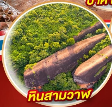
หินสามวาฬ