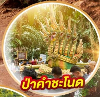
ป่าคำชะโนด