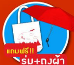
แถมฟรี!! ร่ม+ถุงผ้า