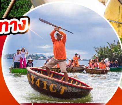
นั่งเรือกระดัง Hoi an