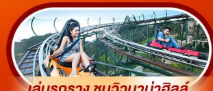
เล่นรถราง ชมวิวบานาฮิลล์