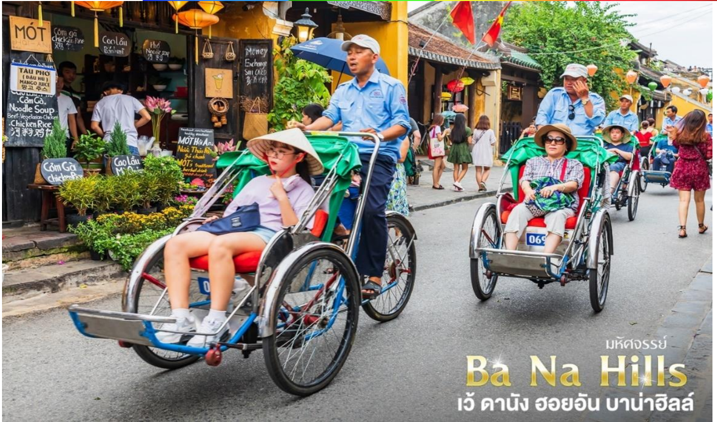
บริษัทจรรยา Ba Na Hills เว้ คานิง ฮอยอัน บาน่าฮิลล์

พิเศษ!! นำท่านนั่งรถสามล้อซีโคล (Cyclo) ชมเมืองเว้ ซึ่งเป็นจุดเด่นและเอกลักษณ์ของเวียดนาม