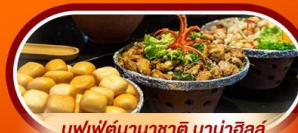
บุฟเฟ่ต์นานาชาติ บานาฮิลล์