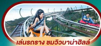
เล่นรถราง ชมวิวบาน่าฮิลล์