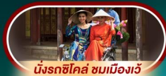
นั่งรถซิโกล์ ชมเมืองเว้

นั่งกระเช้าที่ยาวที่สุดในโลก ขึ้นสู่บาน่าฮิลล์ ชมเมือง ฮอยอัน เมืองมรดกโลกที่สวยงามและเจียบสงบ พิเศษ!! บุฟเฟ่ต์นานาชาติ บาน่าฮิลล์