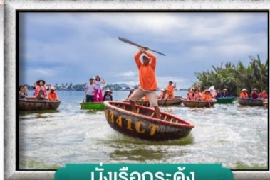
นั้งเรือกระดั่ง