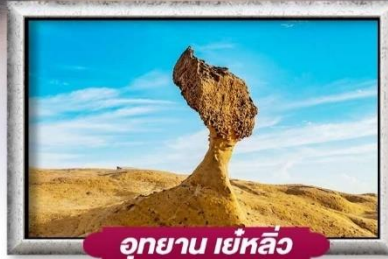
อุทยาน เย่หลิว