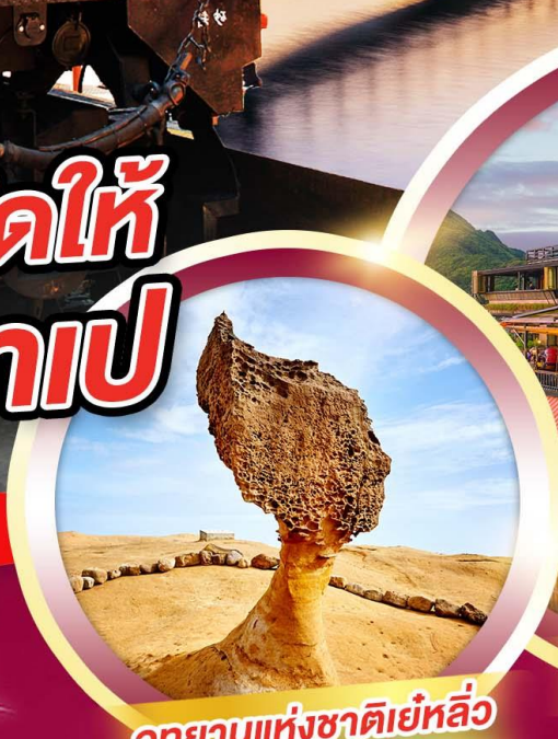
อุทยานแห่งชาติหยี่หลิว