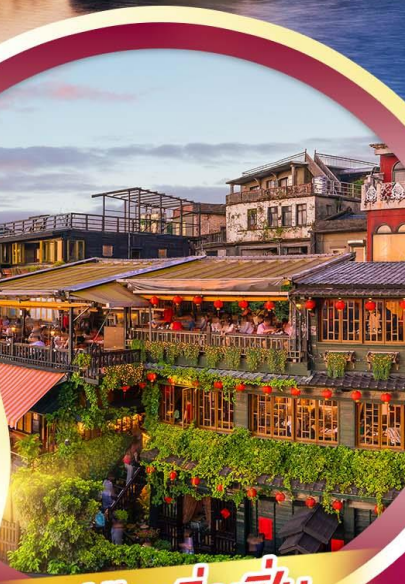
หมู่บ้านจิวเฟิ่น