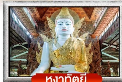
หงาทัตยี

พิเศษสุด!! เมนูกุ้งแม่น้ำเผา + ครัวเช้าเข้าประเทศพม่า