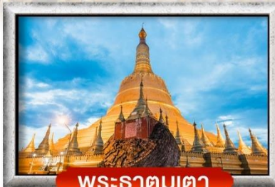
พระธาตุมูเตตา